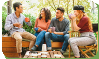
Encuesta en línea