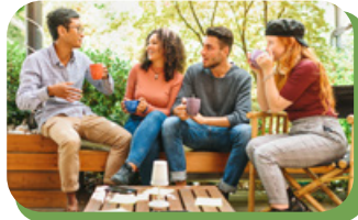
Groupes de discussion